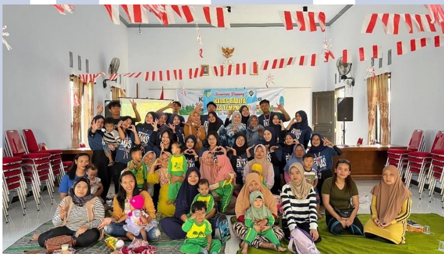
Gambar 5 Pelaksanaan edukasi dan pembuatan PUDITA

Dengan ini diharapkan masyarakat lebih peduli dengan pertumbuhan dan perkembangan anak, sedangkan ibu hamil memiliki pengetahuan yang lebih baik tentang stunting dan gizi seimbang untuk balita, sehingga akan mencegah terjadinya stunting pada balita dan menurunkan angka kejadian stunting