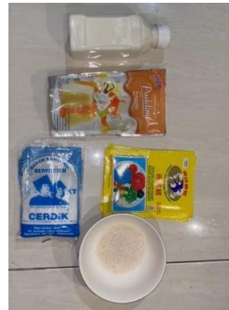
Gambar 1. Bahan PUDITA