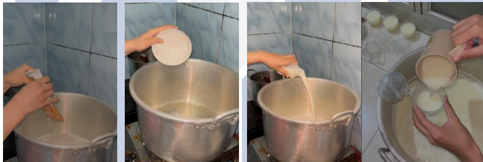
Gambar 2. Proses pembuatan PUDITA (Puding Susu Etawa)

Gambaran pengetahuan ibu balita dan ibu hamil tentang stunting dan PUDITA dapat dilihat pada gambar berikut: