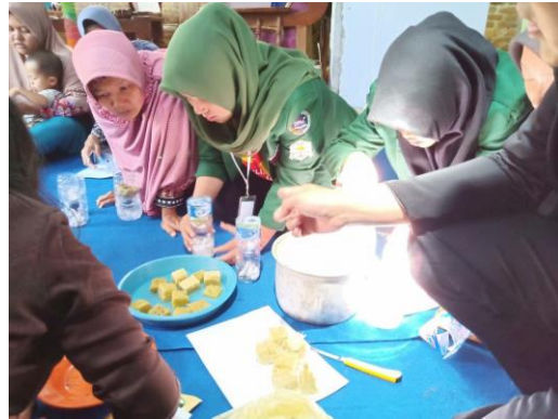
Gambar 4. Pelatihan proses penyemaian bibit kangkung dan selada air