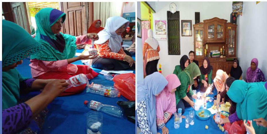
Gambar 5. Praktek langsung pembuatan media tanam budidaya sayuran hidroponik menggunakan limbah botol plastik

Setelah kegiatan pelatihan pembuatan hidroponik yang dimulai dengan sosialisasi pemaparan dan teori tentang hidroponik, kemudian dilakukan pelatihan langsung yaitu cara penyemaian bibit kangkung dan selada air serta cara membuat wadah hidroponik dari botol air mineral bekas. Berdasarkan hasil kuisisioner setelah kegiatan berlangsung, terdapat peningkatan pengetahuan mitra pengabdian masyarakat yang sangat signifikan. Terlihat pada gambar 2. responden menyatakan semuanya mengetahui tentang hidroponik, baik tentang manfaat, model-modelnya, media, serta cara pembuatannya. Hal ini terbukti dengan hasil kuisisioner 100% menjawab “ya”. Berdasarkan hasil tersebut, dapat dinyatakan bahwa pelatihan pembuatan tanaman hidroponik dengan memanfaatkan botol plastik bekas berhasil.