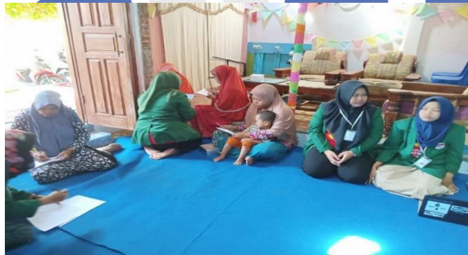
Gambar 1. Peserta mengisi kuesioner sebelum dilaksanakan pelatihan

Sebelum penyampaian materi dilakukan pretest terlebih dahulu untuk mengetahui tingkat pengetahuan peserta tentang cara bercocok tanam secara hidroponik menggunakan botol bekas. Tim pengabdian membagikan kuesioner yang diisi oleh peserta.