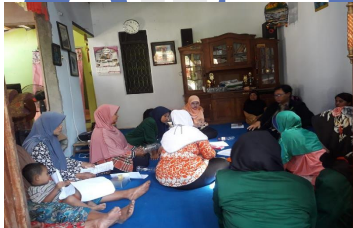
Gambar 3. Sesi tanya jawab setelah penyampaian materi budidaya sayuran hidroponik

Setelah paham tentang cara bercocok tanam secara hidroponik, peserta langsung mempraktekkan cara bercocok tanam menggunakan metode hidroponik dengan memanfaatkan limbah botol plastik. Peserta dibimbing dengan beberapa mahasiswa untuk langkah langkah pembuatannya.