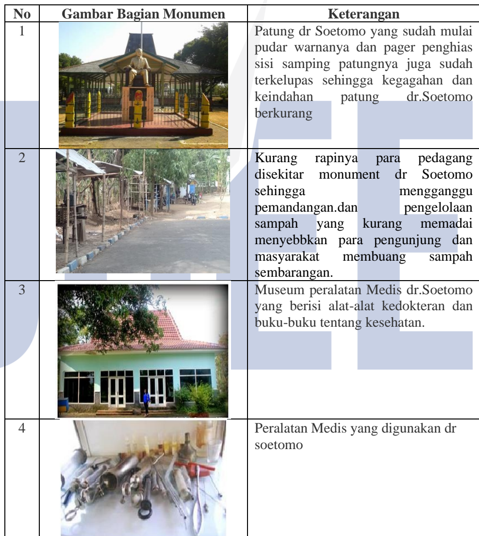
Tabel 2 Keadaan Monumen dr. Soetomo