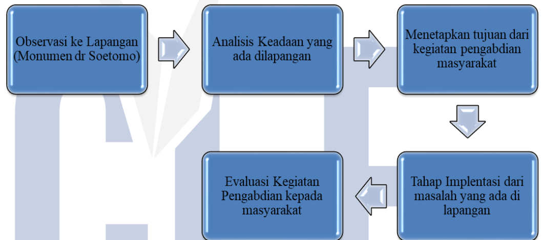
Gambar 1 Diagram alir Pengabdian Masyarakat.

Dengan sistem pembuatan alur kegiatan Pengabdian team pengusul akan lebih mudah untuk menentukan solusi masalah yang dimiliki oleh mitra sehingga akan sangat efektif sekali dalam kegiatan pengabdian masyarakat ini. Dengan penggambaran alur pengabdian masyarakat juga memudahkan team pengusul untuk melakukan evaluasi hasil kegiatan sehingga pengusul akan mudah untuk mendapatkan hasil pengabdian secara maksimal.