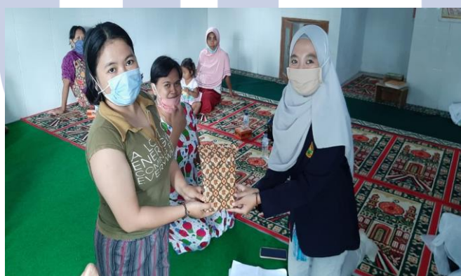
Gambar 5. Pemberian Hadiah