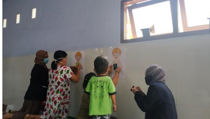
Gambar 3. Pelaksanaan Emo-Demo

yang dapat timbul dari konsumsi makanan, dan minta ibu A dan ibu B membandingkan warna perut masing-masing anak dengan kartu kesimpulan, dan membaca penjelasan di kartu yang sesuai dengan kondisi perut anak. Setelah permainan selesai fasilitator menunjuk satu sukarelawan untuk menjelaskan ulang makna dari permainan tersebut. Kemudian fasilitator memberikan penjelasan mengenai tujuan dan inti permainan. Terakhir fasilitator memberikan lembar post test yang sudah disediakan.