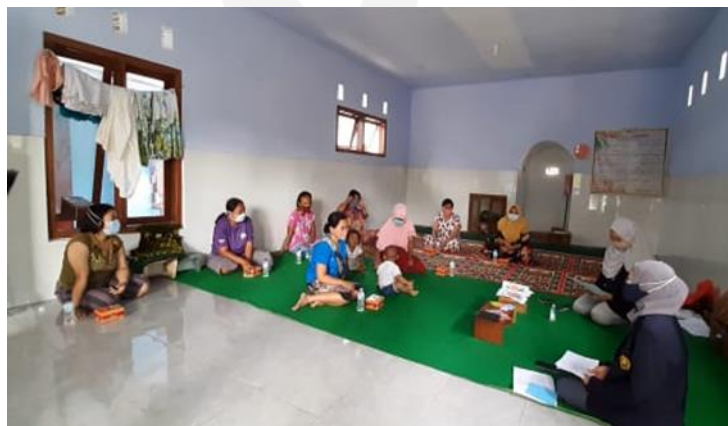
Gambar 2. Sambutan dan Penjelasan

Memulai diskusi dengan mengajak dua relawan untuk maju, fasilitator membacakan cerita minta ibu untuk mengambil gambar makanan atau camilan sesuai dengan cerita yang telah diceritakan, untuk cerita pertama yaitu mengenai konsumsi makanan sehat dan untuk cerita kedua konsumsi makanan tidak sehat. Siapkan peralatan kertas warna (hijau: vitamin, kuning: karbohidrat, merah: protein, hitam: pengawet) dan dua gambar perut bayi sebagai media untuk menempelkan kertas warna dan mulailah berdiskusi, sebelumnya jelaskan mengenai arti warna pada kertas yang akan dibagikan. minta seluruh responden untuk menyebutkan bahan yang terkandung dalam makanan / camilan anak ibu A dan ibu B secara bergantian. Saat responden menyebutkan bahan kandungan makanan, fasilitator memberikan kertas warna sesuai dengan yang telah disebutkan. Setelah ditempelkan semua, tarik kesimpulan secara bersama-sama kandungan zat gizi apa yang mendominasi diperut masing-masing anak. Selanjutnya fasilitator meminta ibu A dan Ibu B untuk membuka kartu kesimpulan yang berisi sebab akibat risiko penyakit