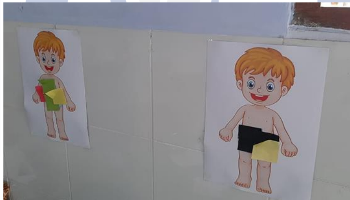
Gambar 4. Perbandingan Antara Konsumsi Cemilan Sehat dan Cemilan Sembarangan

Peserta kegiatan Emo-Demo di Desa Ajung Kecamatan Kalisat merupakan ibu-ibu dari anak-anak sekolah dengan target undangan 10 orang, akan tetapi hanya 9 ibu-ibu saja yang bisa menghadiri acara ini. Peningkatan pengetahuan pada ibu-ibu anak sekolah di Desa Ajung Kecamatan Kalisat Kabupaten Jember mengenai Cemilan Sembarangan dapat diketahui melalui lembar pretest dan posttest yang telah dibagikan. Pada lembar pretest dan posttest, diberikan sepuluh pertanyaan mengenai pengetahuan tentang cemilan/jajanan sembarangan. Pretest dan posttest tersebut diberikan pada 9 orang ibu-ibu anak sekolah yang mengikuti kegiatan Emo-Demo tersebut.