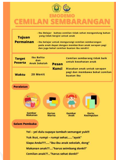
Gambar 1. Modul Emo-Demo Camilan Sembarang